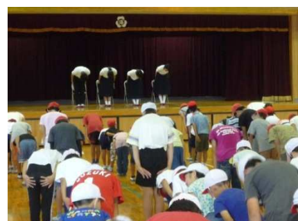
両城小学校、港町小学校で、両城中学校生徒による「二川しぐさ（あいさつ）」の指導